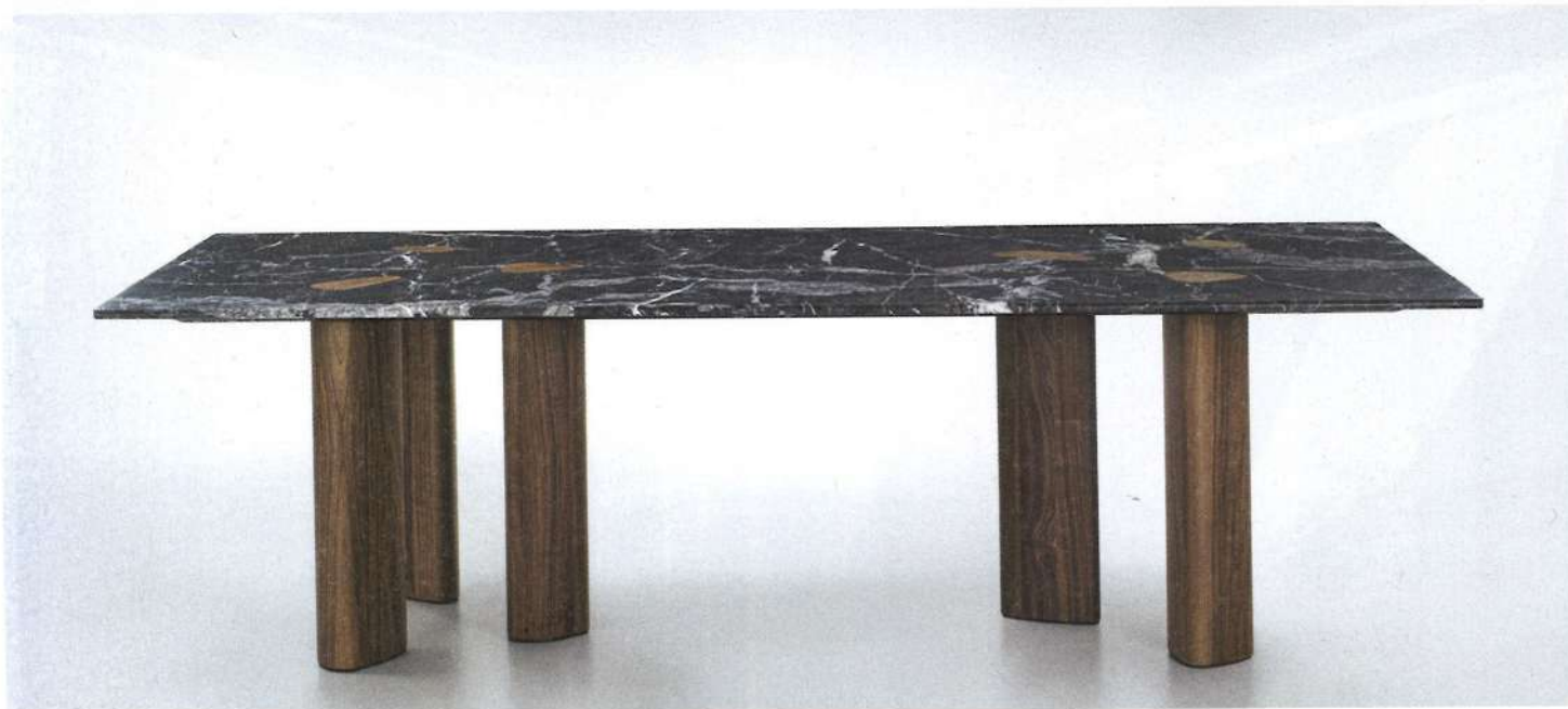
PORADA, OSWOOD, DESIGN PATRICK JOUIN Tavolo da pranzo rettangolare con piano di marmo grigio carnico e sei gambe scultoree in massello di noce canaletto che terminano a vista sul top. Cm 120x260. ● Rectangular dining table with grey Carnic marble top and six sculptural legs in solid canaletto walnut that can be seen at the top. 120x260 cm. porada.it