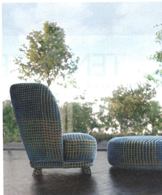
VALENTINI, CRISS CROSS, DESIGN GIAN PAOLO VENIER - STUDIO OTTO Poltrona interamente rivestita con un tessuto tartan sviluppato da Abitex in esclusiva per il brand, ispirato alla lavorazione jacquard. Cuscini sfoderabili. Cm 87x73,5x41-101 h. ● Armchair entirely covered with a tartan fabric developed exclusively for the brand by Abitex, and inspired by jacquard manufacturing. Removable cushions. 87x73.5 cm, height 41-101 cm. valentini.it